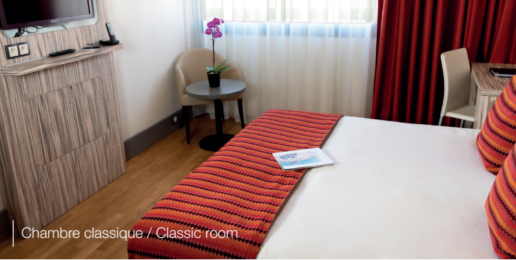
Chambre classique / Classic room