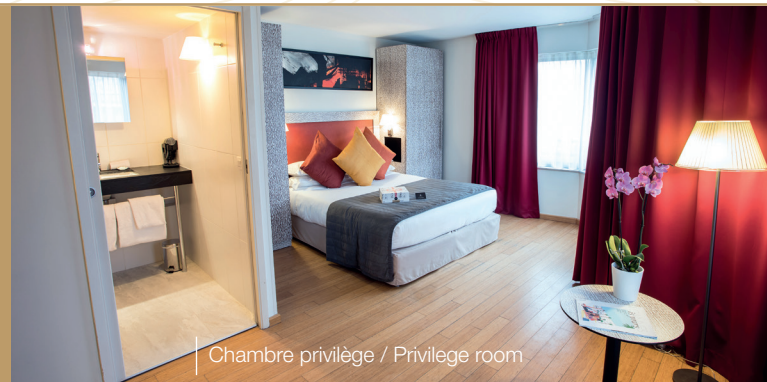
Chambre privilège / Privilege room

Servizi in camera : telefono, TV con schermo LCD, cassaforte, Internet gratuito Wi-Fi, vassoio di cortesia, aria condizionata, accappatoio, pantofole, prodotti per il bagno, asciugacapelli.