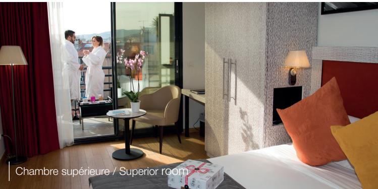
Chambre supérieure / Superior room